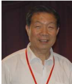
会长 何新贵 中国工程院院士 博士生导师 中国载人航天工程软件组组长